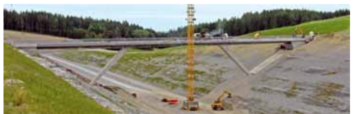
Straßenüberführung über den Einschnitt Theuern im Bau, 2009