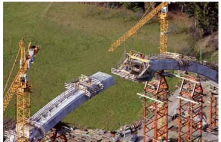
Bau des Bogens, 2009

Dieses Projekt wird kofinanziert von der Europäischen Union Transeuropäische Netze für Verkehrsinfrastrukturen (TEN)