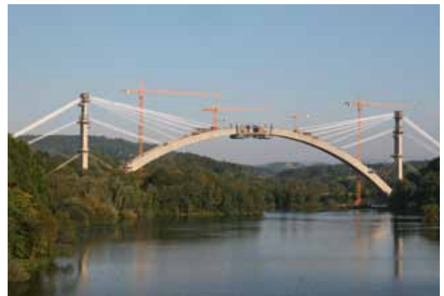
Über dem Froschgrundsee entsteht im Freivorbau der Bogen, 2008

Im Zuge der Neubaustrecke (NBS) Ebensfeld–Erfurt überquert die zweigleisige Trasse im Bauabschnitt Rödental östlich der Gemeinde Weißenbrunn vorm Wald das Tal des Pöpelbaches und im weiteren Verlauf den Froschgrundsee in zirka 65 Meter Höhe. Die Talform ist geprägt durch steil ansteigende Talflanken und einen etwa 300 Meter breiten ebenen Talraum mit dem Froschgrundsee. Der Talraum ist auf der Südseite mit einer Gemeindeverbindungsstraße und dem natürlichem Flusslauf der Itz sowie begleitenden Gehölzen und auf der Nordseite mit der Staatsstraße St 2206 begrenzt.