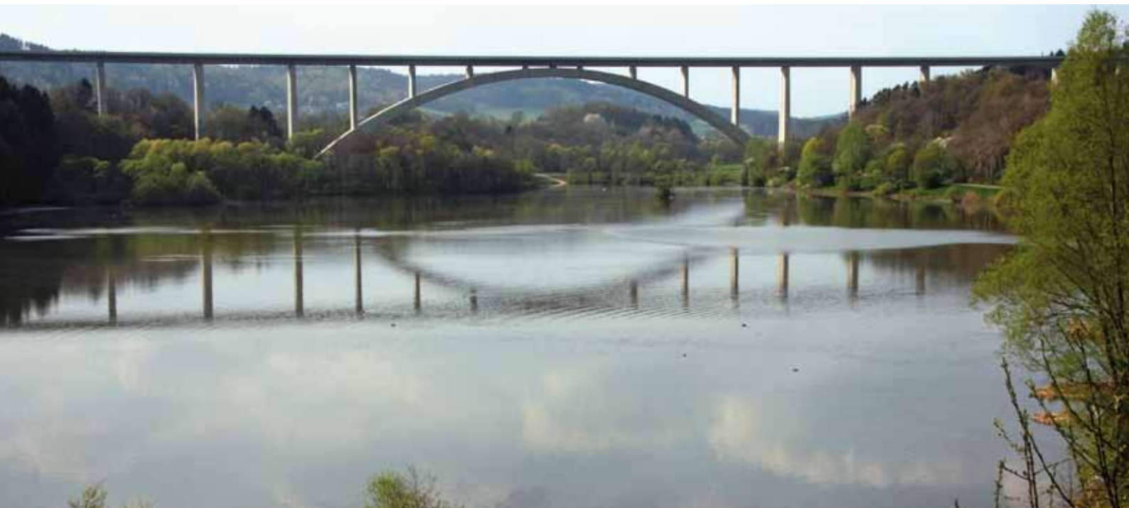
Eisenbahnüberführung Talbrücke Froschgrundsee, 2011

der Widerlager und der Brückenpfeiler ist der Brückenüberbau hinter dem südlichen Widerlager entstanden und wurde mit einer Taktschiebeanlage feldweise von Pfeiler zu Pfeiler ohne Beeinträchtigung des Talgrundes eingeschoben. Auf den Bauwerken werden jeweils auf der Westseite vor Inbetriebnahme der Neubaustrecke Schallschutzwände als Maßnahmen des aktiven Schallschutzes angeordnet.